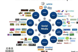
Social Media Landscape

Bitte beachten Sie: Die Einladung zum Workshop kann erst nach Zahlungseingang erfolgen.